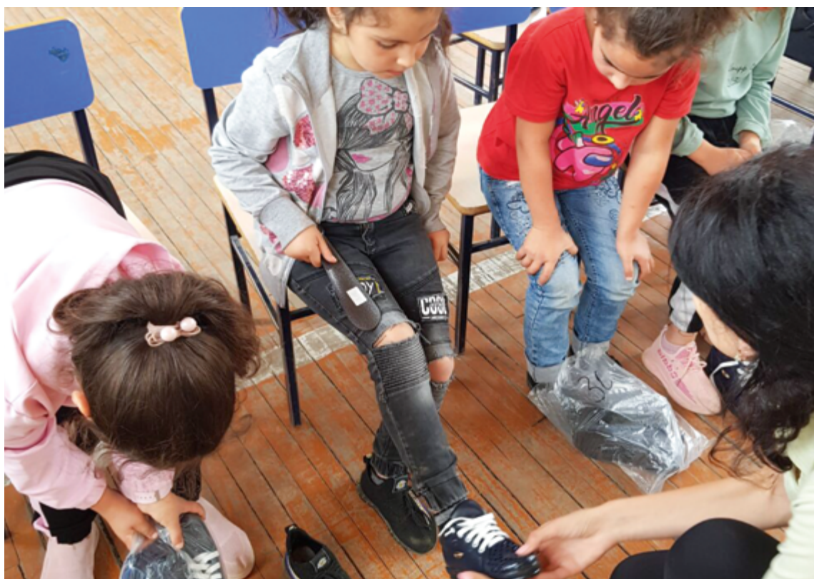
Zum Schulbeginn Anfang des Jahres schenkt Little Bridge vielen Kindern Winterkleider und Schuhe