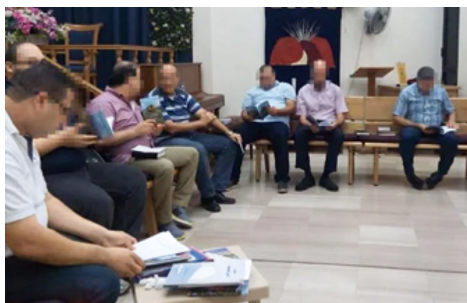
Eine von zahlreichen neu gegründeten christlichen Glaubensgemeinschaften