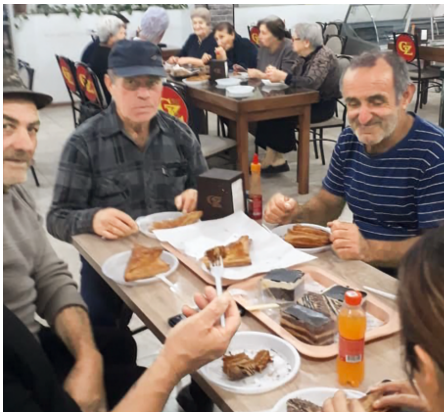
Zeit für Kaffee und Kuchen