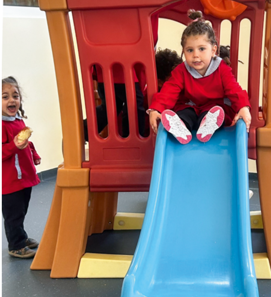
Fröhliche Kinder beim Spielen im Kindergarten

gen. Eine ältere Dame, die Museumsleiterin, erklärt mir die Karte. Mit einem Lächeln im Gesicht sagt sie selbstbewusst: «Unsere Ortschaft kann sich an den Seiten noch ausdehnen und größer werden. Das Potenzial dazu haben wir.» Das habe ich schon einmal gehört, denke ich bei mir.